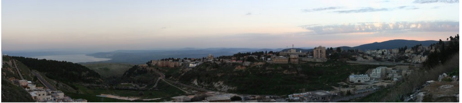
- Panorámica de Safed con el Mar de Galilea en el fondo -