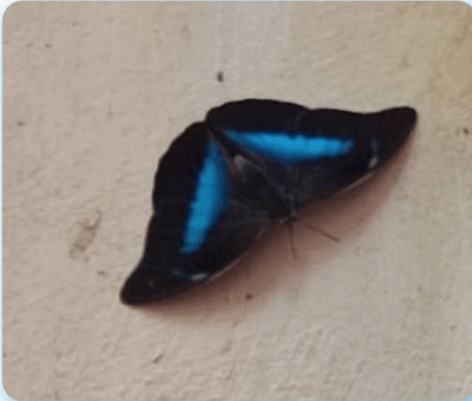
“Mariposa Resplandeciente” (“Panambí Verá”)