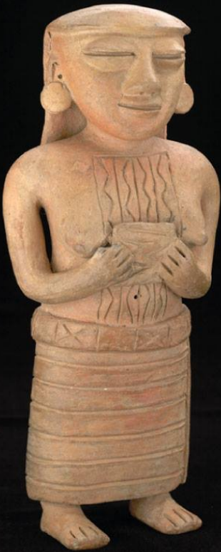
Figura femenina, Llanuras del Caribe, Tradición Zenú 200 a.C. al 1600 d.C. Colección Museo del Oro.

de sus pertenencias y la mayor cantidad de oro posible, para ser enterrado allí, en señal de reverencia a los dioses.”