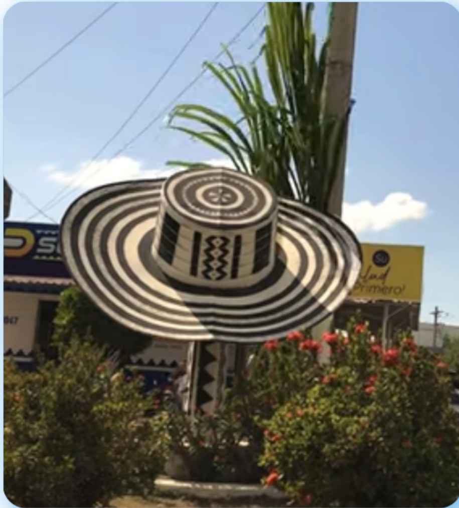
Monumento al “Sombrero Vueltaio” en Tuchín, Córdoba, Colombia.