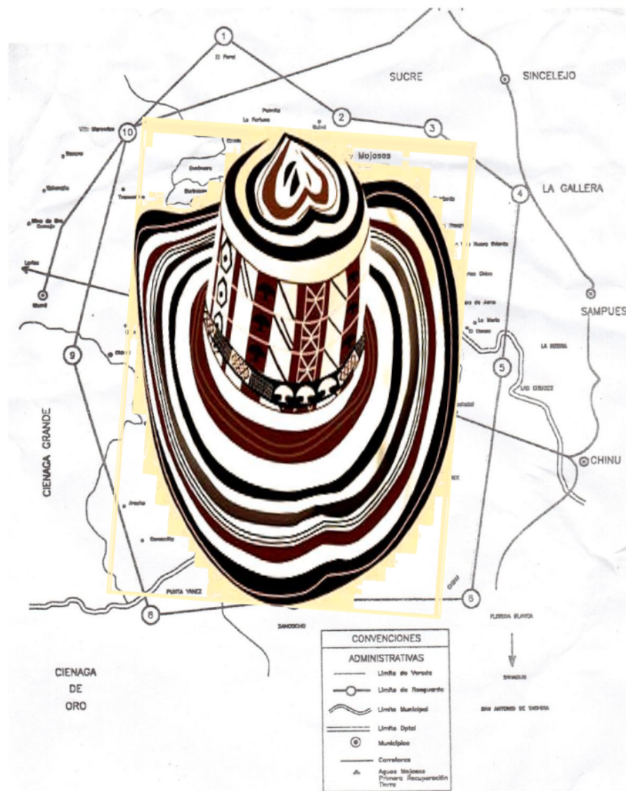
Mapa del resguardo de San Andrés de Sotavento

“39 En este mapa se encuentra la ubicación del resguardo indígena Zenú de San Andrés de Sotavento, en el departamento de Córdoba, Colombia. En él se halla ubicada la leyenda del sombrero vueltiao, el Resguardo es un sombrero, que le da identidad al pueblo Zenú.”